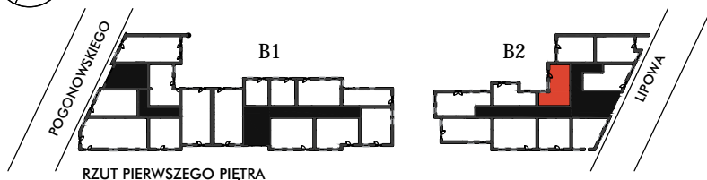
RZUT PIERWSZEGO PIĘTRA