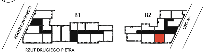
RZUT DRUGIEGO PIĘTRA