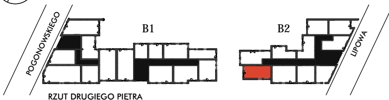
RZUT DRUGIEGO PIĘTRA