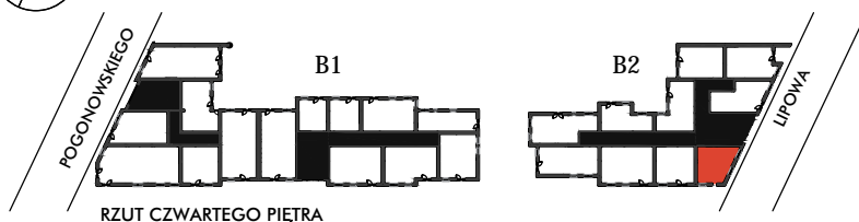
RZUT CZWARTEGO PIĘTRA